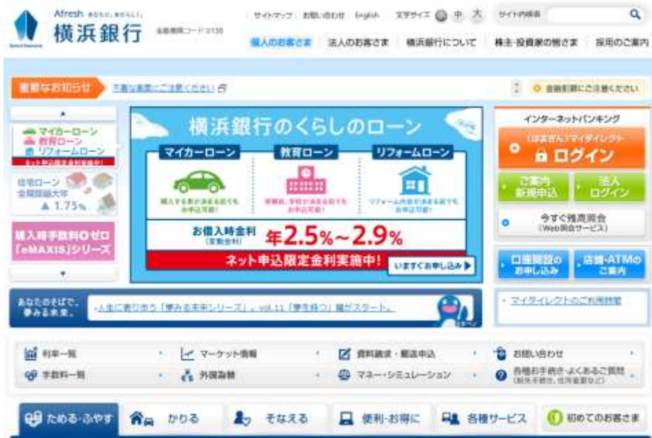
▲Rtoaster を導入した横浜銀行のウェブサイト

本サービスは、横浜銀行のダイレクトチャネル（非対面系取引）強化の一環として、店舗での対面営業と同じように、お客さまごとのライフステージやライフスタイルにあわせて最適な商品をレコメンド（*2）するという目的のもと、2015年1月より同行のウェブサイトへ導入されました。