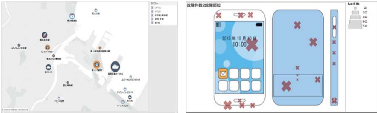
▲演習で作成するマップビューの例 (左：観光地と集客数、右：携帯電話の故障件数と部位)