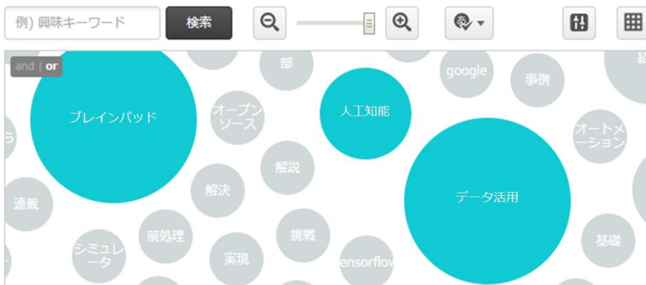
▲DeltaCubeの管理画面に表示された興味キーワード、円の大きさは興味関心のあるユーザー数

http://www.brainpad.co.jp/news/2016/12/07/4161