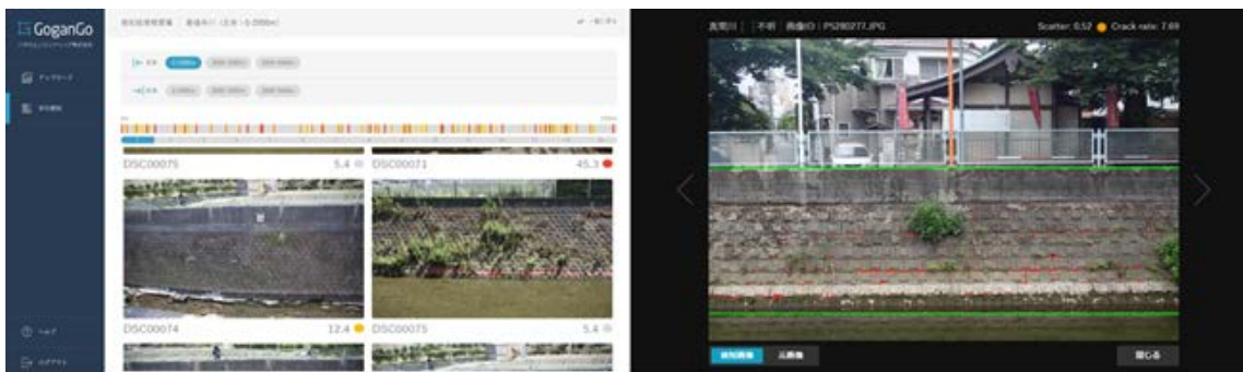
▲「GoganGo」の実際の操作画面（左）と、劣化検知画面（右） ※赤線部分が検知された劣化

当システムに画像をアップロードすると護岸の劣化領域が検知され、その劣化具合が河川の上流からの位置情報と共にグラフィカルに表示されます。