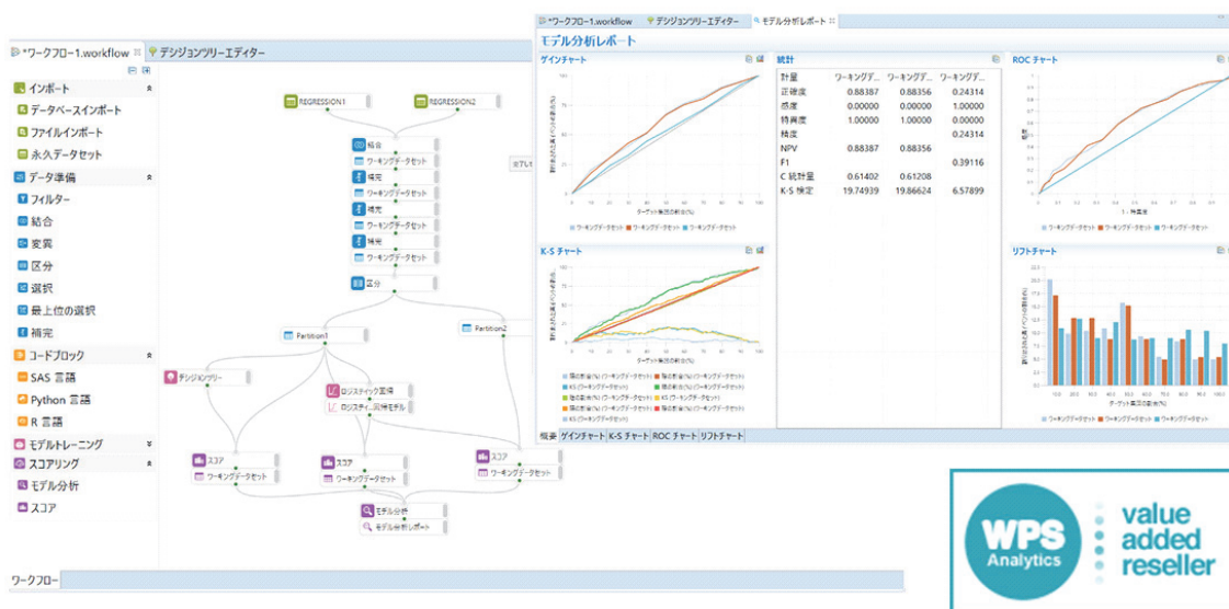
WPS Analyticsのワークフロー画面と作成されるレポート

GUI による直感的な操作性を実現し、プログラムを記述せずにドラッグ&ドロップの簡単な操作で、モデリングからスコアリング、検証までの作業を実施することができます。また、さまざまなレポートも簡単に作成することが可能です。